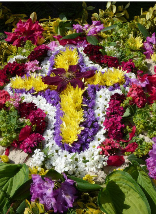
Blumenschmuck bei der Fronleichnamsprozession

Seinen Abschluss fand das Projekt lokaler Pastoralplan beim Pfarrkonvent. Hier hatte die Gemeinde wieder einmal Gelegenheit sich einzubringen und die Leitsätze nun mit Leben zu füllen. Ein Projekt ist abgeschlossen, aber der Prozess der Umsetzung geht weiter, jetzt und jeden Tag. Nicht alles bestehende, was Kirche ausmacht, bedarf einer Erneuerung, aber es besteht vielfach der Wunsch nach Veränderung. Für die Umsetzung zeichnet sich nun der Pfarreirat verantwortlich, wobei ihm heute mehr denn je eine wertschätzende Unterstützung zugesagt werden muss, damit Kirche und insbesondere Kirche vor Ort eine erlebbare und lebendige Kirche ist.