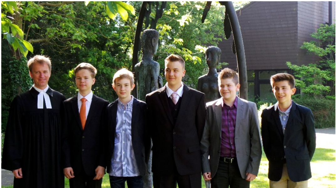
Konfirmation 2014 in Nienberge