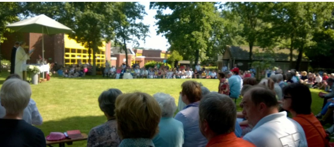
Der ökumenische Gottesdienst am Pfingstmontag bei strahlendem Sonnenschein