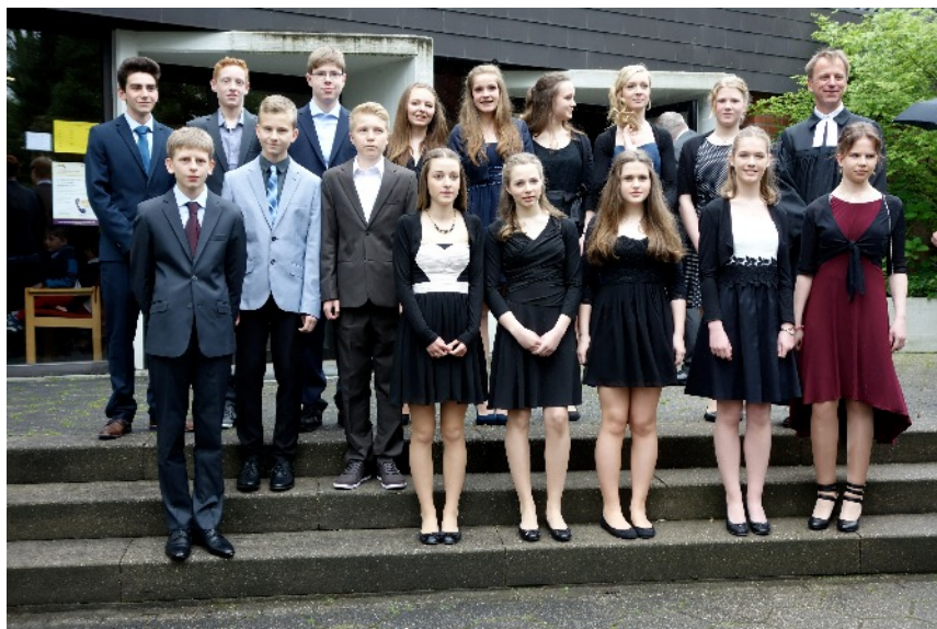
Konfirmation 2014 in Havixbeck

Für diese großen Konfi-Gottesdienste gilt jeweils, dass wir sie gemeinsam mit den Nienbergern in Havixbeck feiern, was an der Größe der Gruppe liegt.