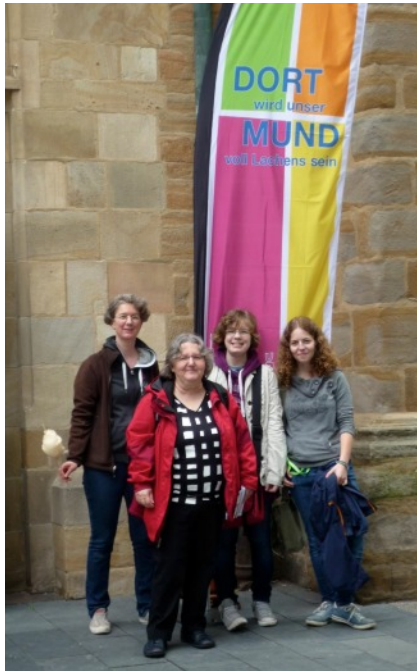
Unser Team bei der Tagung