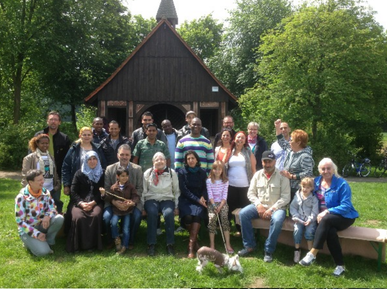
Das bunte Fest der ausländischen Mitbürgerinnen und Mitbürger an der Bruder-Klaus-Kapelle